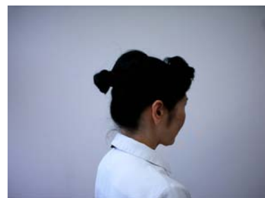
このように変わります

看護師のユニホームは、 白色のワンピースまたはチュニックタイプ(上下) で ピンク色の名札 をつけております。お気軽にお声をかけてください。