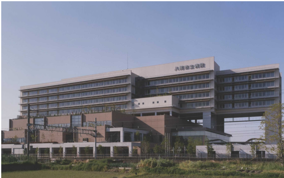
【北側よりの当院全景】