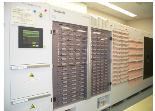
注射薬自動払い出しシステム(アンブルピッカー)

A. 注射薬自動払い出しシステム、注射調製業務ではクリーンルーム内にクリーンテーブル、安全キャビネットなど他病院に先駆けて最新の機器・設備を備えました。機器を扱うスタッフも他病院で研修を行い、優れた技術を身につけています。今後もその設備を駆使して医療の質の向上に貢献していきます。