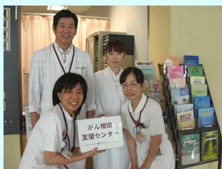
相談実績（20年4月～21年12月）

受付・お問い合わせ：2階 がん相談支援センター TEL.072-922-0881【代表】