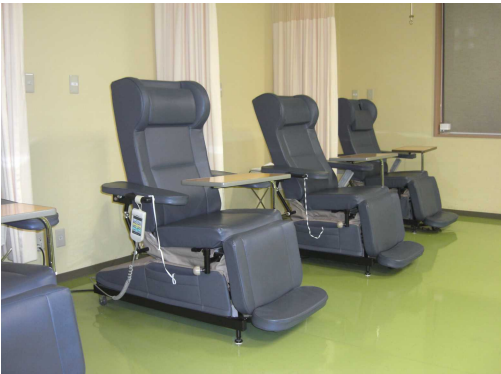
通院治療センター(化学療法室)

A. 患者さんご自身がセルフケアできるよう支援するために、より個別的に患者さんの状態を観察・評価したうえで具体的なケア・援助を行っていききたいと思います。