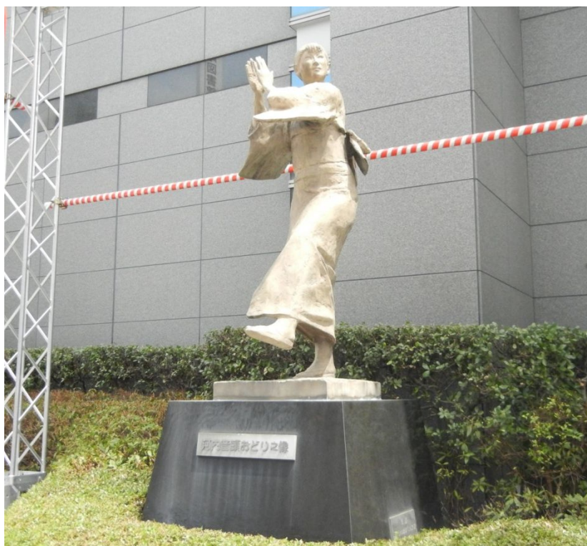
八尾市役所前：河内音頭おどり之像