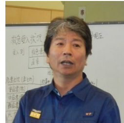
田中 誠太 八尾市長