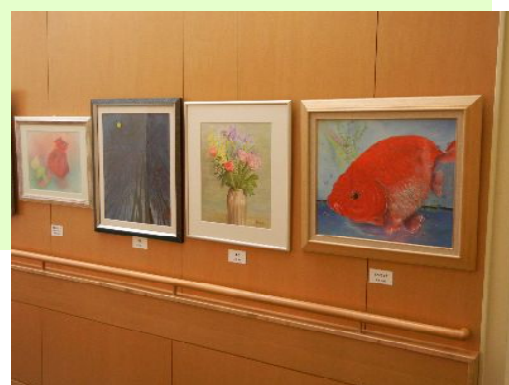
2階外来フロア 市民ギャラリーストリート