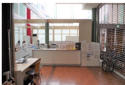
1階 ⑥地域医療連携センター

（内科系、耳鼻咽喉科、整形外科、皮膚科の受診に関しては紹介状及び予約のある方みの診療となっておりますのでご注意ください。）