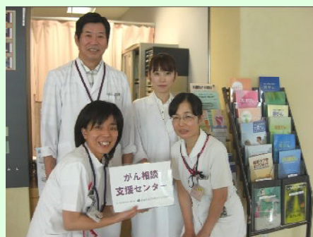
相談実績(20年4月～22年3月)

受付・お問い合わせ：2階 がん相談支援センター ☎ 072-922-0881【代表】