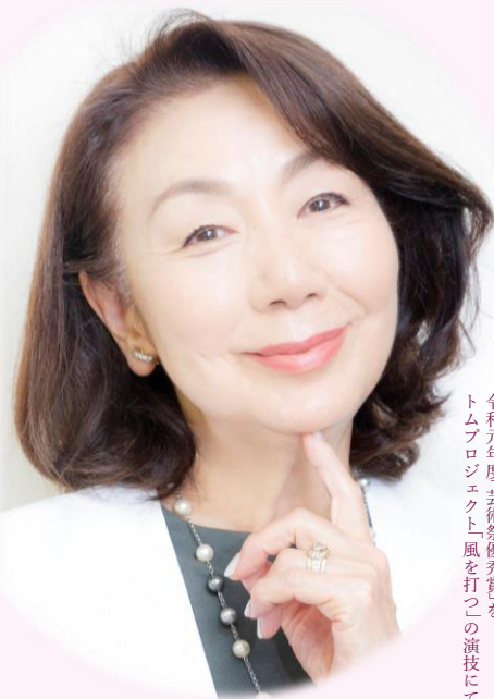
令和元年度、芸術祭優秀賞を トムプロジェクト「風を打つ」の演技にて授賞